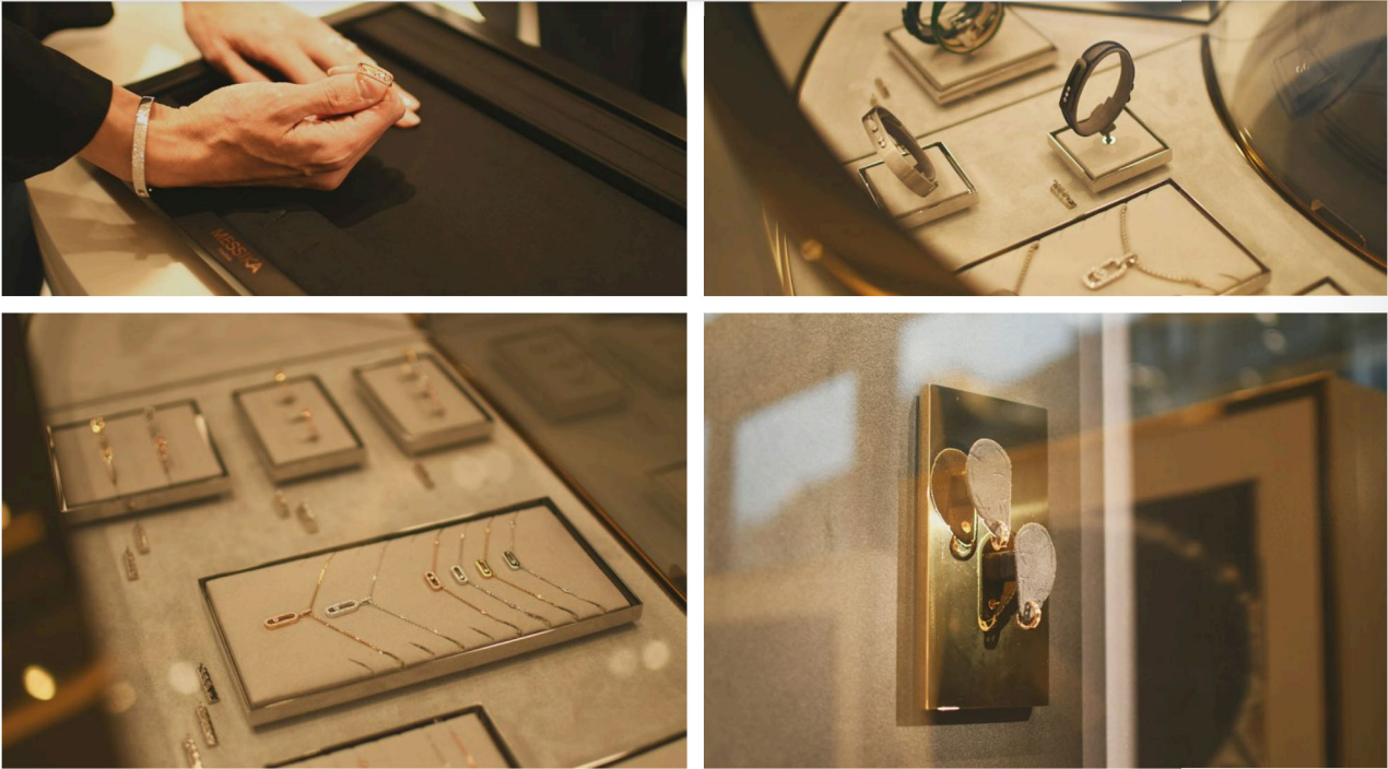
Boutique Messika