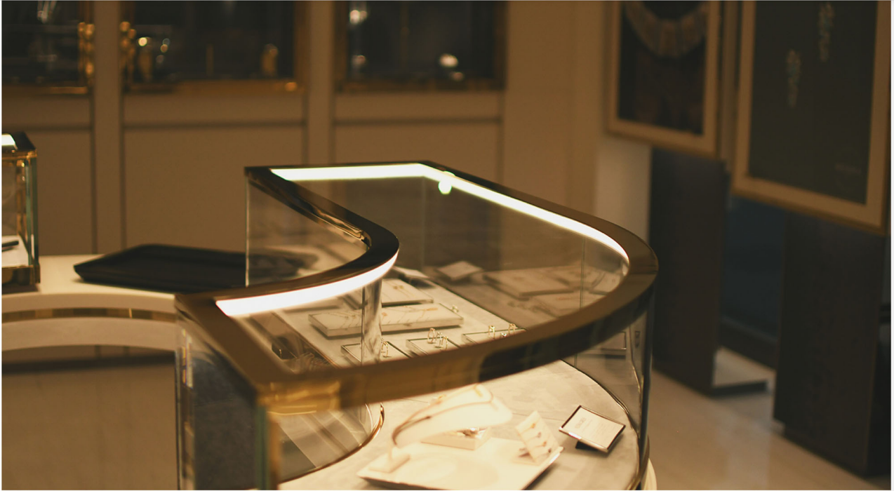
Boutique Messika