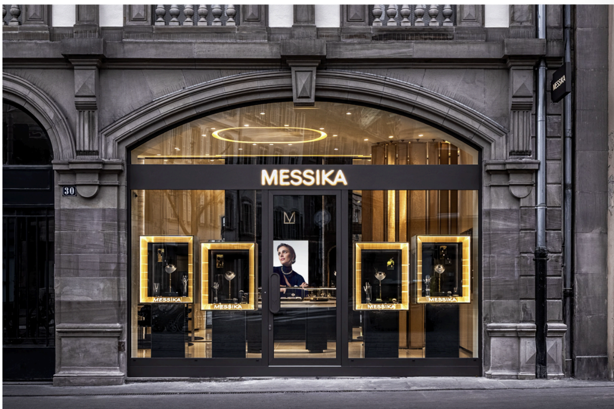
Boutique Messika