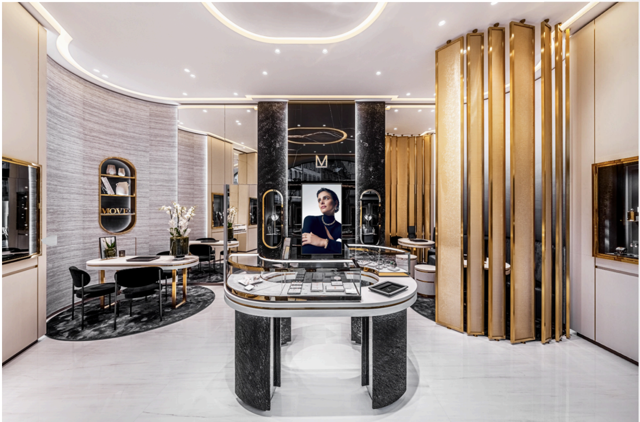
Boutique Messika

Dynamiser la rue de la Mésange : Messika débarque pour faire briller les yeux des Strasbourgeois(es)