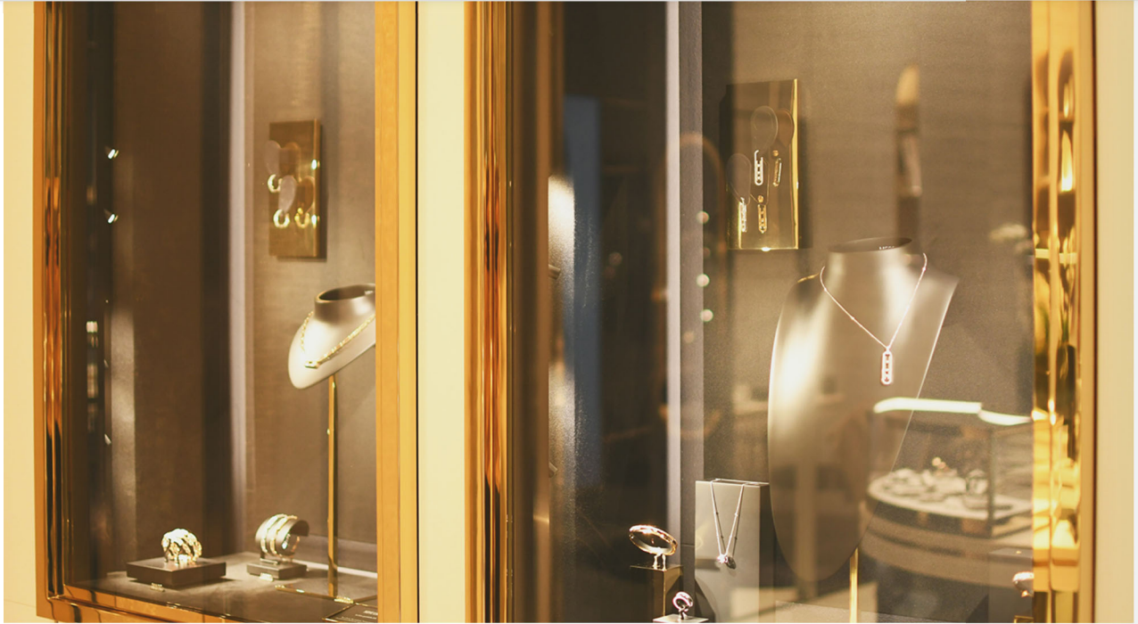
Boutique Messika